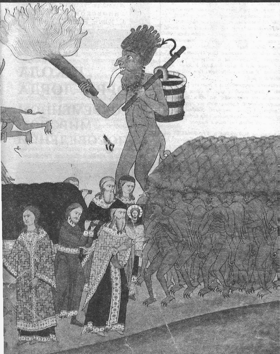
Рукопись конца XIX в. Там же, л. 64.

(Записал О.Р.НИКОЛАЕВ от неизвестной рассказчицы в Рожновском сельсовете Клинцовского района Брянской области в 1985 г.)